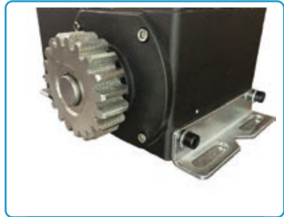
Base en fundición metálica