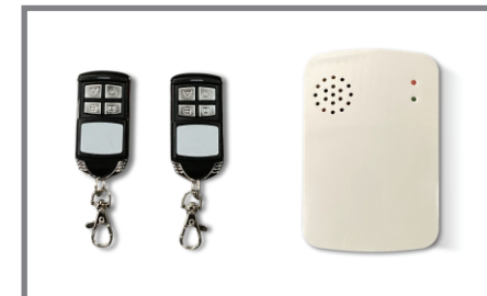
Receptor y dos (2) controles remoto