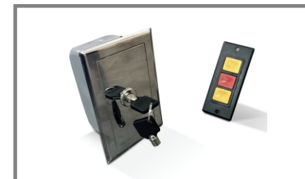
Botonera de tres (3) pulsos