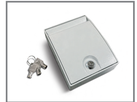
Caja metálica para accionamiento del sistema de manual y pulsador