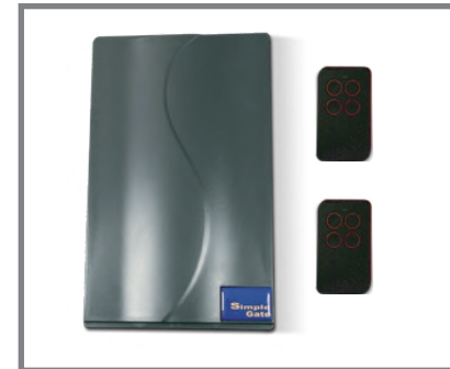
Tarjeta electrónica y dos (2) controles remoto